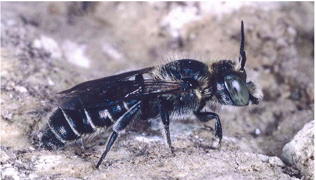
Die auf den Gewöhnlichen Natternkopf angewiesene Natternkopf-Mauerbiene

Ein großes Problem für einige Insektenarten stellt zudem die kurze Zeitspanne dar, in der sie Nahrung aufnehmen können bzw. in der ihnen ihre Wirtspflanze zur Verfügung steht. Verschwindet diese – beispielsweise durch großflächige, frühzeitige Mahd – besteht für sie keine Möglichkeit, genug Nahrung zum Überleben zu finden. Dies kann zu großen Verlusten führen. Eine Möglichkeit, die Lebensbedingungen zu verbessern, stellt die Ansaat von Blühflächen und Blühstreifen dar. Sie dienen der Förderung des Blütenangebots und bieten außerdem einer Vielzahl von Käfern, Wanzen, Fliegen und Spinnen einen Lebensraum. Diese wiederum stehen Vögeln und anderen insektenfressenden Tierarten als Nahrungsquelle zur Verfügung. Zudem profitieren Vögel vom reichlichen Angebot an Pflanzensamen. Auch können Blühflächen und Blühstreifen – bei entsprechender Anbindung und Abmessung – einen Beitrag zum Biotopverbund leisten und der Nützlingsförderung dienen.