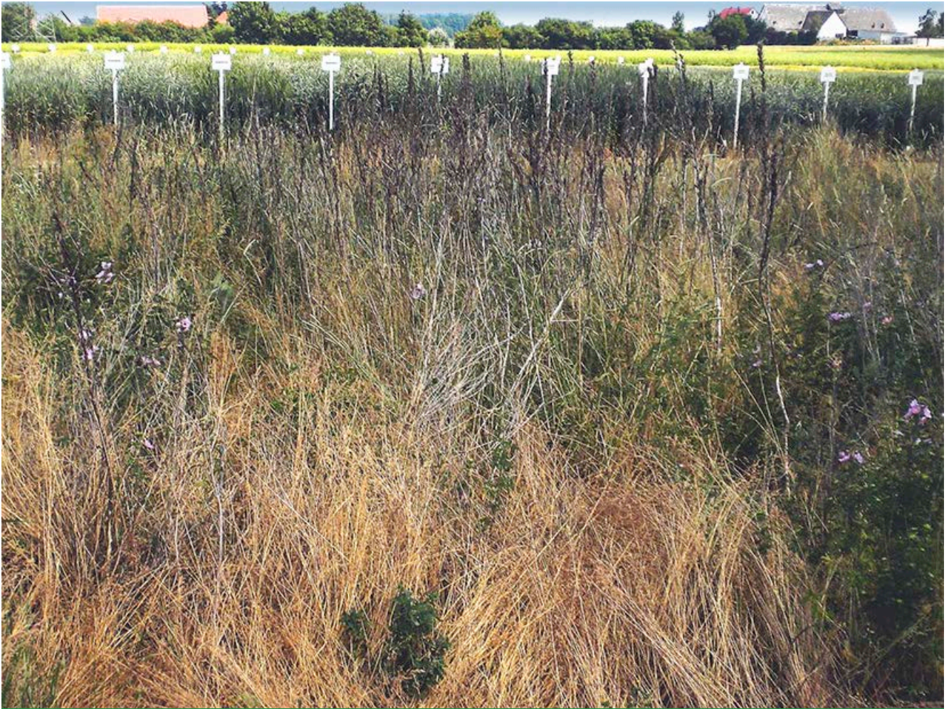
Mehrfährige Blühmischung im vierten Jahr

Im Winter jedoch sieht dies anders aus. Nachdem die letzten Pflanzen verblüht sind, bleiben vertrocknete, dürre Stängel stehen. Aus ökologischer Sicht sind diese sehr wertvoll, da sie einer Vielzahl von Tieren als Nahrung sowie Nist- und Unterschlupfmöglichkeit dienen.