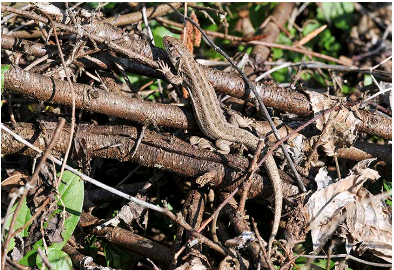
Weibliche Zauneidechse sonnt sich in einem Asthaufen

Einen ähnlich positiven Effekt wie die Anlage von Holzhaufen hat das Liegenlassen von nicht zu feinem Schnittgut aus Gehölzpflegemaßnahmen. Auch dieses verrottet und bietet einer Vielzahl von Tier- und Pflanzenarten einen Lebensraum, auch wenn bei dieser Maßnahme im Allgemeinen weniger strukturierte Sonderstandorte entstehen. Des Weiteren können ganze Bäume, die etwa im Zuge einer Auslichtung von Gehölzflächen entlang von Straßen entnommen werden, auf der Fläche verbleiben. Gleiches gilt für Einzelgehölze, die aufgrund verkehrssicherheitstechnischer Gründe gefällt werden mussten. Hier muss darauf geachtet werden, dass die Verkehrssicherheit nicht beeinträchtigt wird.