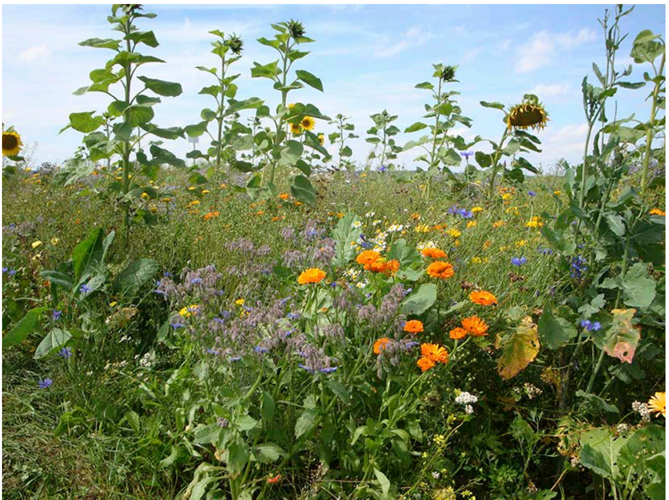
Mehrjährige Blümmischung im ersten Jahr

Grund für eventuell auftretende Beschwerden ist die etwas „spezielle“ Ästhetik, die mehrjährige Blühflächen, vor allem im Winter, auszeichnet. Wie bereits erwähnt, werden solche Flächen unter Umständen über mehrere Jahre nicht gepflegt und bleiben die komplette Zeit über stehen. Im Frühjahr und Sommer der ersten Jahre erscheinen sie vielfältig und farbenfroh, da immer irgendwelche Arten blühen.