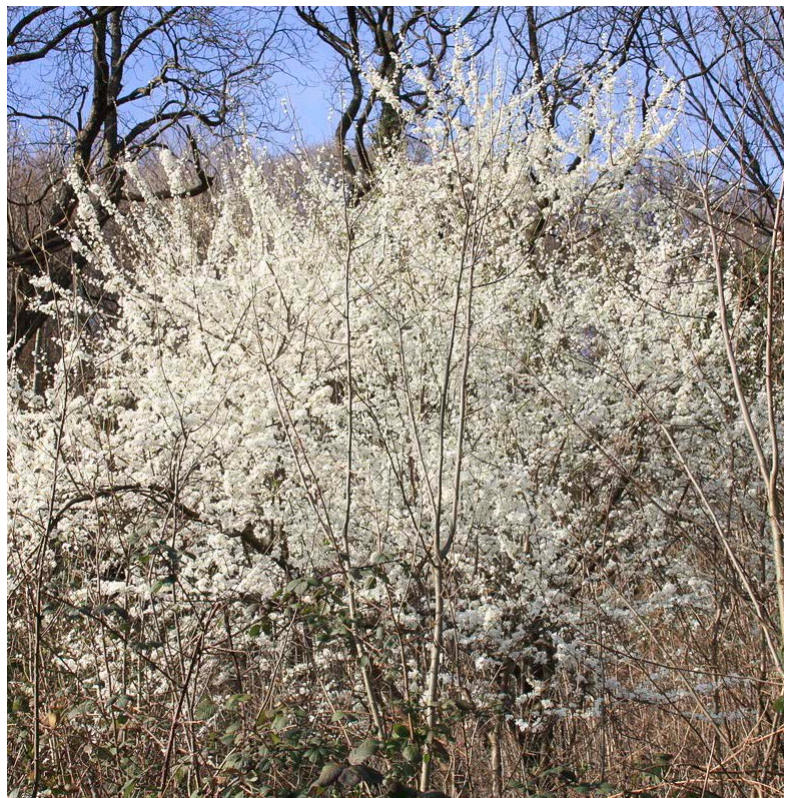
Blühende Gehölze bieten blütenbesuchenden Insekten eine zusätzliche Pollen- und Nektarquelle