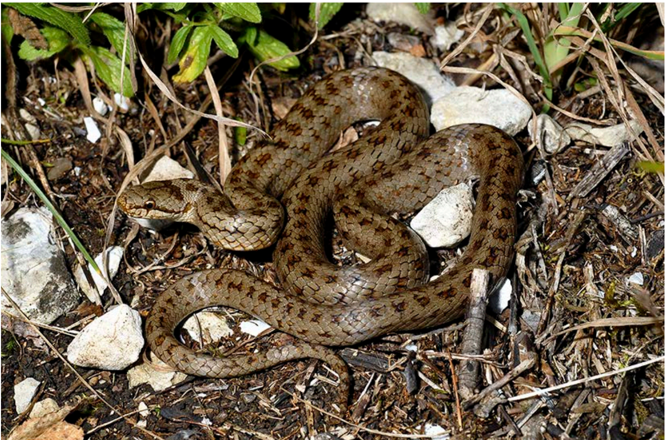
Schlingnatter ( Coronella austriaca )

Zur Erhöhung der Artenvielfalt entlang von Straßen können Steinhaufen und Steinwälle etwa im Zuge von Straßenbaumaßnahmen zum Beispiel auf Straßenböschungen angelegt werden. Besonders geeignet sind dabei fahrbahnabgewandte, sonnenexponierte, windgeschützte Standorte, die ausreichend weit (>10 m, besser >20 m) von der Fahrbahn entfernt sind. Im Idealfall bestehen in der Umgebung bereits entsprechende Strukturen. Wenn möglich, sollten gruppenartig mehrere größere und kleinere Haufen oder Wälle geschichtet werden, die nicht mehr als 20–30 m auseinander liegen. Durchaus sinnvoll ist es auch, bereits strukturreiche Flächen mit Steinhaufen oder -wällen zu ergänzen.