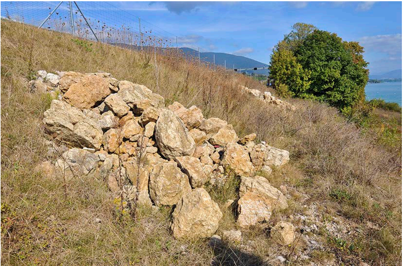
Neu angelegter Steinhaufen entlang einer Autobahnböschung in der Schweiz

Der Unterhaltsaufwand solcher Kleinstrukturen ist im Allgemeinen sehr gering. Zu beachten ist, dass aufkommendes Gebüsch nach Bedarf entfernt wird.