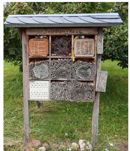
Insektenhäuser wie dieses bieten einer Vielzahl von Insektenarten einen künstlichen Nistplatz

Bei der Ansaat von Blühflächen und Blühstreifen sollte darauf geachtet werden, dass das Saatbett feinkrümelig-locker vorbereitet und nicht klumpig ist. Für den Erfolg einer Ansaat ist die Saatbettbereitung besonders wichtig. Wird dieser nicht genug Aufmerksamkeit geschenkt, können in der Folge Probleme mit unerwünschten Unkrautarten auftreten. So werden weniger konkurrenzstarke Arten der Blühmischung rasch von Unkräutern überwuchert und können sich nicht etablieren. Des Weiteren erfordern stark verunkrautete Flächen entsprechende Gegenmaßnahmen, bevor ein Bestand etabliert werden kann. Treten z. B. „Problemunkräuter“, wie etwa die Ackerwinde ( Convolvulus arvensis ) oder besonders konkurrenzstarke Neophyten (= Pflanzenarten, die sich in Gebieten ansiedeln, in denen sie zuvor nicht heimisch waren) auf, so kann dies ggf. dazu führen, dass zunächst von einer Ansaat von Blühmischungen abzusehen ist, bis die „störenden“ Arten von der Fläche verdrängt sind. Da hierbei von einem Herbizideinsatz abzusehen ist, sollten „scho-nende“ Alternativen zum Einsatz kommen. Grundsätzlich könnte dies