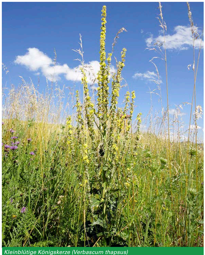
Kleinblütige Königskerze ( Verbascum thapsus )

Unterschieden wird zwischen ein-, über- und mehrjährigen Blühmischungen. Als ökologisch besonders wertvoll haben sich Ansaaten mit mehrjährigen Saatmischungen erwiesen. Diese sind in der Regel sehr artenreich, um möglichst lange und vielfältige Blühaspekte („Trachtfießband“) zu gewährleisten. Zumeist enthalten sie einen höheren Anteil an Saatgut von Wildarten, die in den intensiv genutzten Kulturlächen häufig nicht mehr vorkommen. Für Wildbienen – im Allgemeinen für „Spezialisten“ – sind solche Wildarten besonders wichtig, da sich ihre Mundwerkzeuge über Jahrmillionen an diese angepasst haben. Mehrjährige Blühmischungen können bei günstigen Standorteigenschaften ggf. ohne Pflegemaßnahmen über mehrere Jahre stehen bleiben. Daher bieten sie vielen Insekten und anderen Tieren, die sich dort einfinden, neben einem reichen Nahrungsangebot auch Möglichkeiten zum Überwintern, zum Nestbau oder zur Eiablage. Als Beispiel kann hier die Dreizahn-Mauerbiene ( Osmia tridentata ) genannt werden. Diese Wildbienenart nutzt dürre, markhaltige Stängel, etwa der Königskerze ( Verbascum spec. ), um darin ihr Nest zu bauen und ihre Eier abzulegen.