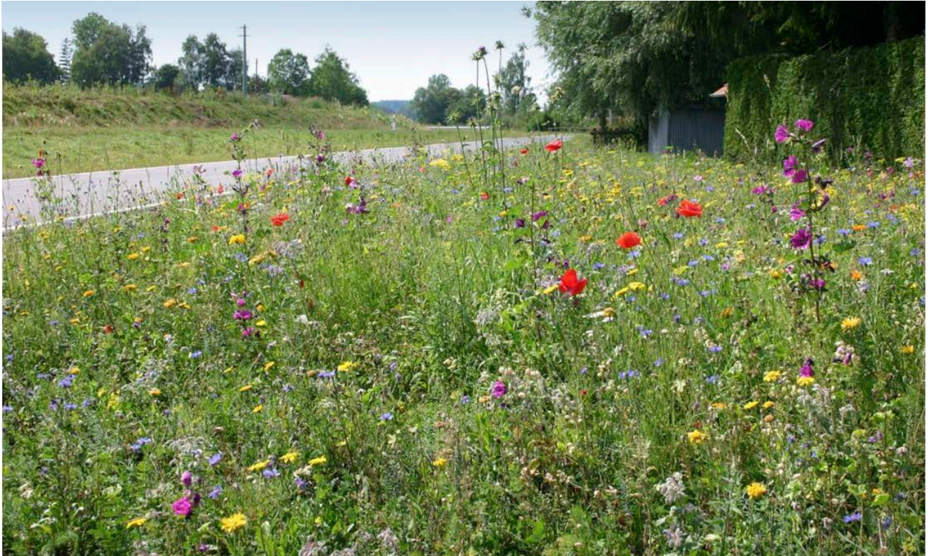
Blumenwiesenmischung in Bad Saulgau (Lkr. Sigmaringen)

Eine weitere Möglichkeit zur Ansaat von Blühmischungen stellen Rast- und Parkplätze dar. Durch Tafeln, auf denen die Bedeutung von Blühflächen und Blühstreifen erläutert wird, und durch das Aufstellen künstlicher Nisthilfen („Insektenhaus“) könnte anschaulich auf die ökologische und ökonomische Bedeutung von Blütenbesuchern und aller sonstigen Tierarten, die von Blühflächen und -streifen profitieren, aufmerksam gemacht werden.