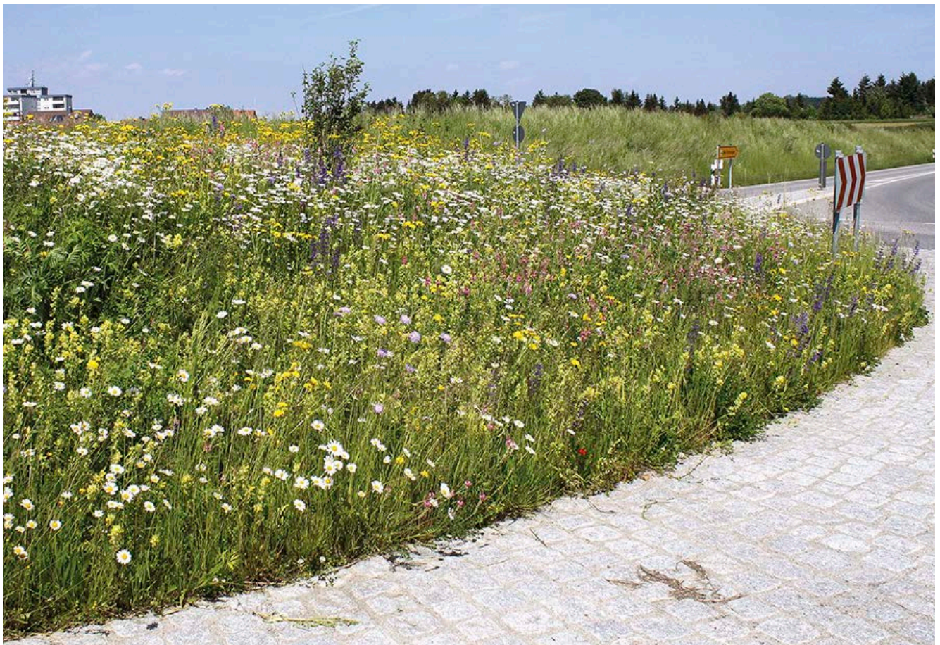
Blühfläche auf einer Verkehrsinsel bei Bad Saulgau (Lkr. Sigmaringen)

In Regionen mit intensiver Landnutzung ist der ökologische Effekt von Blühflächen und Blühstreifen größer als in Regionen mit extensiver Landnutzung, in denen Tieren und Pflanzen eine größere Vielfalt an Lebensräumen zur Verfügung steht. Als mögliche Standorte zur Ansaat von Blühflächen und -streifen entlang von Straßen können praktisch alle Flächen außerhalb des Intensivbereichs – wie etwa Böschungen, Verkehrsinseln oder Anschlussohren – dienen. Besonders geeignet sind sonnige Standorte, da durch zu starke Beschattung die Entwicklung der Pflanzen behindert werden kann. Die Breite von Blühflächen und -streifen sollte fünf Meter nicht unterschreiten. Je breiter sie angelegt werden, desto mehr Lebensraum bieten sie. Bei der Auswahl des Standorts muss zudem beachtet werden, dass dieser zur Reduktion der anfallenden Unterhaltungskosten maschinell gepflegt werden kann. Aus naturschutzfachlicher Sicht besonders interessant ist die Ansaat auf mageren Standorten, da die für diese Flächen verwendeten Saatmischungen in der Regel auch seltenere, eher konkurrenzschwache Arten enthalten. Diese wiederum können unter anderem Insektenarten als Nahrungsquelle dienen, deren Spektrum auf wenige Pflanzenarten eingeschränkt ist. Außerdem kommen auf mageren Standorten weniger Unkräuter vor, die eine erfolgreiche Entwicklung von Blühflächen – vor allem in der sensiblen Etablierungsphase – beeinträchtigen könnten.