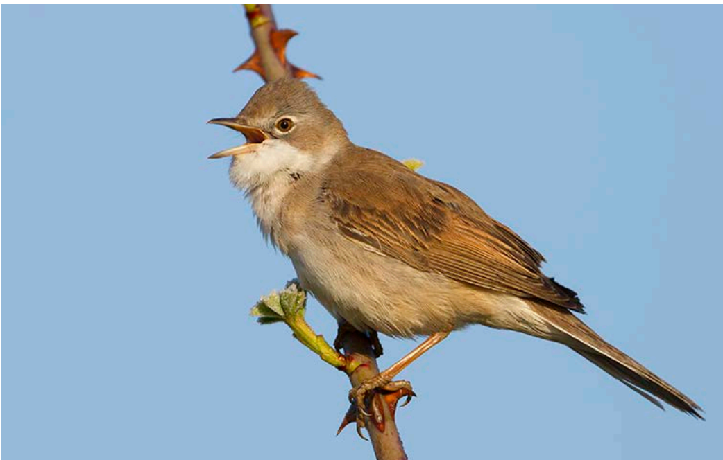
Abgestorbene Pflanzen aus dem Vorjahr stellen für die Dorngrasmücke während der Brutzeit wichtige Lebensräume dar.

Wird der Konkurrenzdruck auf die angesäten Arten durch starke Verunkrautung zu groß, müssen die Blühflächen und Blühstreifen gemäht oder gemulcht werden. Bei starker Verunkrautung am Boden ist ein Schröpfschnitt ca. acht Wochen nach Auflaufen der Saat zu empfehlen. Vor allem in der Etablierungsphase (erstes Jahr nach der Ansaat) können solche Maßnahmen notwendig sein. Dabei ist zu beachten, dass nicht zu tief gemäht bzw. gemulcht wird, um die Jungpflanzen der Blümmischung nicht zu schädigen. Als Richtwert gilt eine Höhe von mindestens 15 cm. Die mechanische Unkrautbekämpfung sollte nicht großflächig, sondern abschnitts- bzw. streifenweise durchgeführt werden.