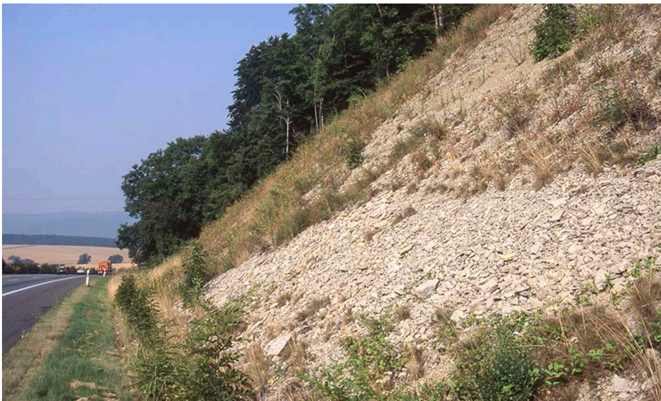
Beispiel für einen künstlich geschaffenen Rohbodenstandort entlang einer Straße

Eine Möglichkeit, die Artenvielfalt entlang von Straßen zu erhöhen, stellt das Schaffen von Rohbodenstandorten dar. Auf solchen nährstoffarmen Standorten kommen in der Regel mehr Pflanzenarten vor als auf nährstoffreichen. Zudem handelt es sich dabei häufig um Arten, die speziell an magere, nährstoffarme Standortverhältnisse angepasst und aus naturschutzfachlicher Sicht besonders wertvoll und interessant sind. Eine Option zur Schaffung von Rohbodenstandorten stellt das Abtragen von nährstoffreichem Oberboden dar, etwa im Zuge von Straßenausbaumaßnahmen. Dabei werden mit schwerem Gerät die obersten Schichten der Böschung entfernt und andernorts wieder eingebaut. Durch die Erhaltung freigelegter Felsbänder, Gesteinsanschnitte und steiler Erdkanten können insbesondere für Kleintiere interessante Sonderstandorte wie z.B. kleinflächige Trockenbiotop entstehen. Bei Neubaumaßnahmen können durch den weitgehenden Verzicht einer Bodenandeckung (max. 5 cm Mächtigkeit) offene Rohboden- und Magerstandorte geschaffen werden. Der zur Andeckung vorgesehene Oberboden sollte in der Nähe seiner Herkunft über entsprechendem Gesteinsuntergrund auf angrenzenden Straßenböschungen mit ähnlichem Entwicklungsziel verteilt werden. Durch die Wiederausbreitung des Oberbodens gelangen viele Sporen und Samen der vorherigen Pflanzendecke auf die Böschungen, was die Entwicklung eines standortgemäßen Vegetationsgefüges erheblich beschleunigen kann.